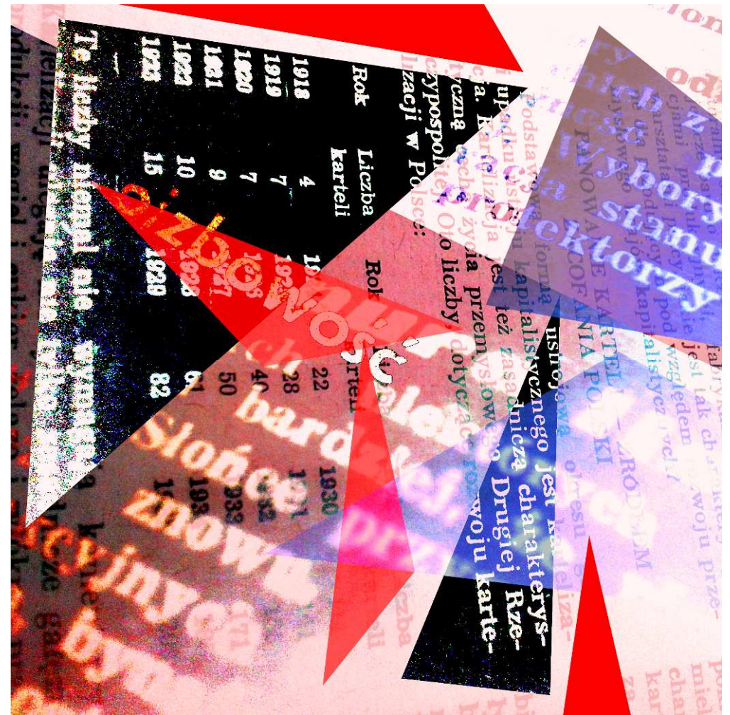
Dodawałem warstwy, żeby nie było nudno. Chociaż i tak najlepiej się czyta po prostu tekst.